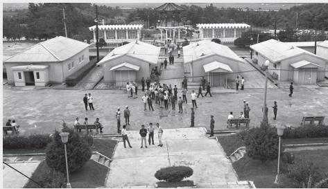
Bàn Môn Điểm năm 1973

bắt đầu từ cuộc họp trù bị cho Hội đàm Chũ thập độ liên Triều, ngôi làng này đã tổ chức hơn 360 cuộc hội đàm liên Triều.